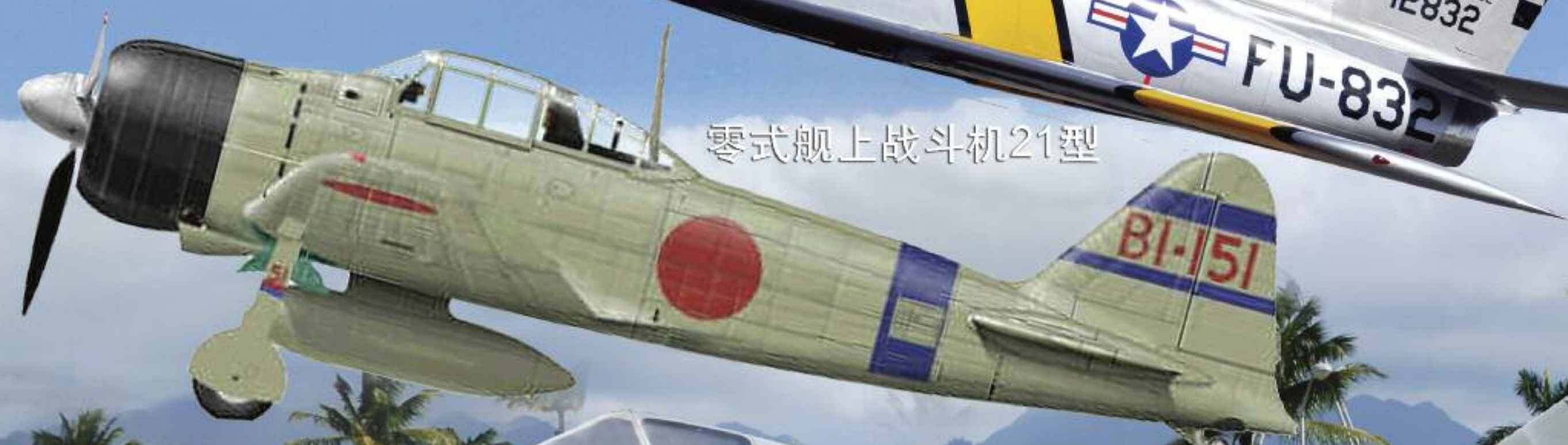
零式舰上战斗机21型