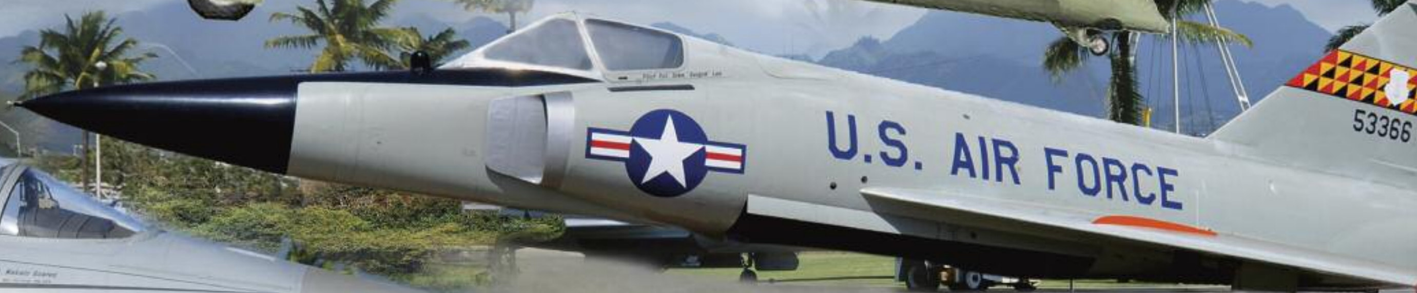
康维尔 F-102A 三角剑式战斗机