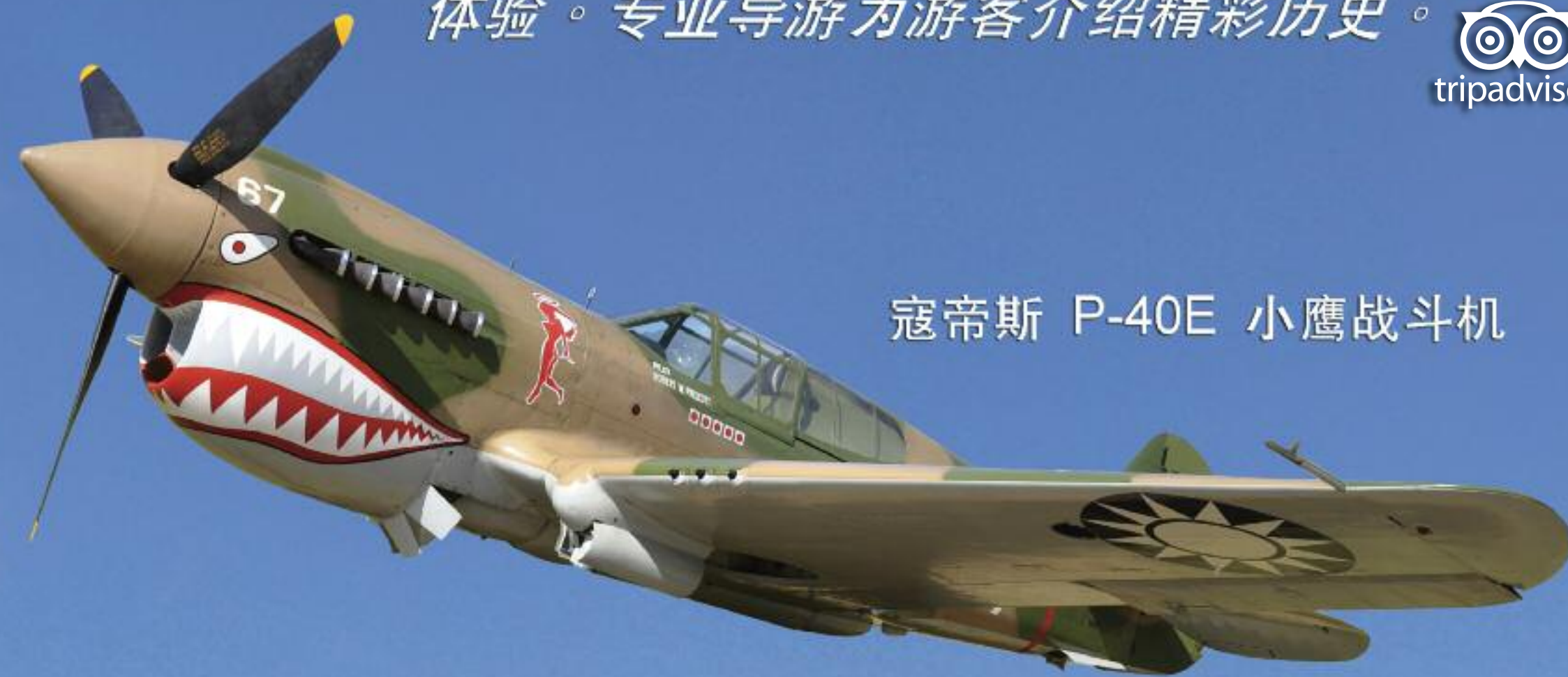
寇蒂斯 P-40E 小鹰战斗机