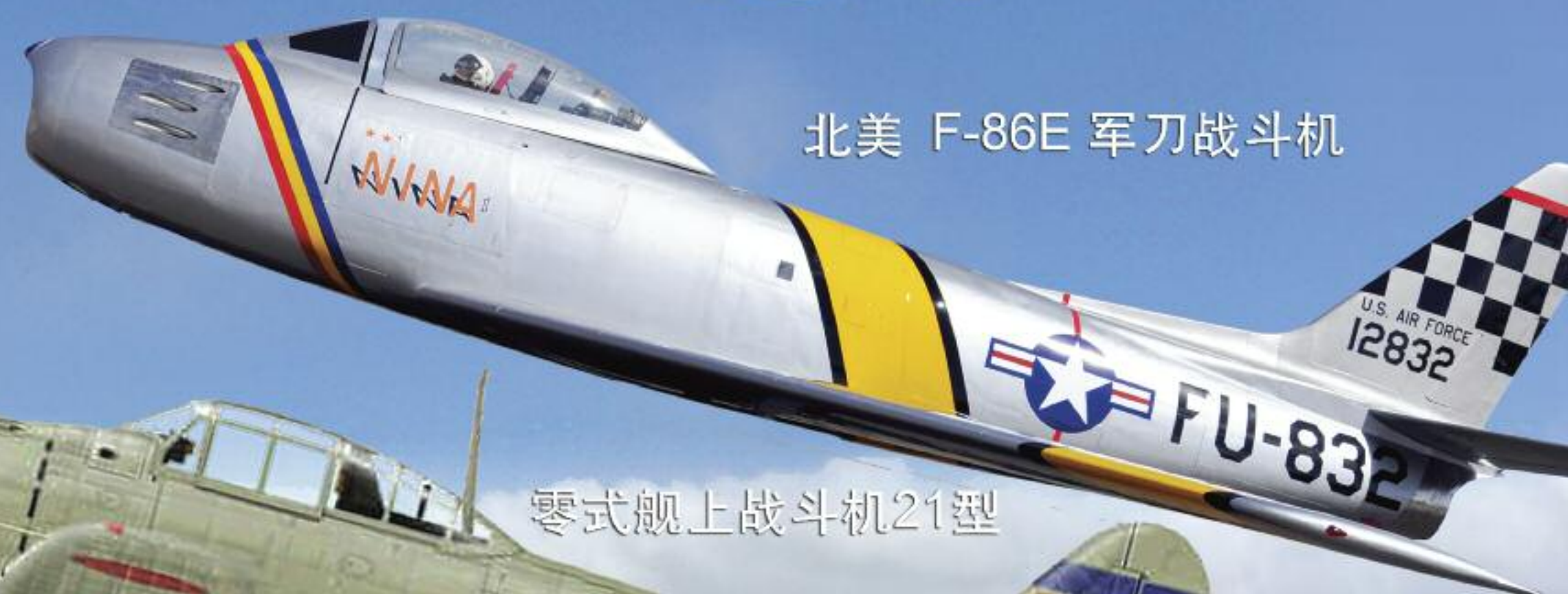
北美 F-86E 军刀战斗机